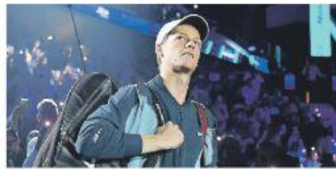
L'ingresso in campo di Jannik Sinner all'Italgas Arena di Torino per l'esordio alle Atp Finals. Il campione azzurro è stato accolto da un'autentica ovazione: il pubblico lo ha poi incitato per tutto il match trascinandolo al successo con De Minaur

Intanto l'americano ieri pomeriggio ha battuto in due set Daniil Medvedev: il russo, eccessivamente nervoso, non ha preso bene l'andamento del match e ha più volte lanciato la racchetta a terra. Dagli spalti è arrivato anche qualche fischi. «Mi sono arrabbiato, mi sono sentito frustrato - si è giustificato il russo - è giustificato il russo - si è giustificato il russo - ero completamente arrabbiato con me stesso, non ce l'avevo con gli altri, non ce l'avevo con nessuno, ma solo con me stesso».