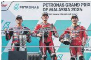
Il podio del Gp della Malesia. Martin, Bagnaia e Bastianini

Martin resta comunque avanti: «Grazie a Bagnaia perché rende questa sfida sempre più difficile». Le parole dello spagnolo: «Volevo vincere ma Pecco aveva una strategia diversa. Ci abbiamo provato ma quando mi ha passato non c'e-