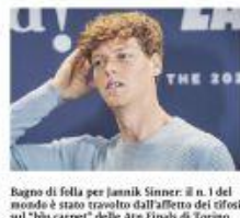
Bagno di folla per Janik Sinner: il n. 1 del mondo è stato travolto dall'affetto dei tifosi sul "blue carpet" delle Atp Finals di Torino