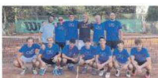
I protagonisti del "Progetto" al Tc Match Ball