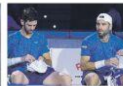
A sinistra un'esultanza di Jannik Sinner, che stasera in semifinale sfiderà Ruud. Sopra il doppio azzurro Vavassori-Bolelli