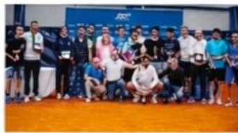
Gruppo finale Open Bnl Monviso dello scorso anno